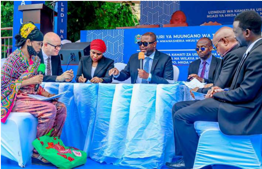
Mhe. Hamza Johari, Mwanasheria Mkuu wa Serikali (aliyeketi katikati), akitoa msaada wa sheria kwa mwananchi wakati wa Kliniki ya Sheria Bila Malipo uliofanyika kwenye viwanja vya Mnazi Mmoja jijini Dar es Salaam.