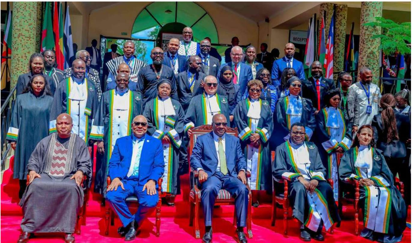
Mhe. John Dramani Mahama, Rais wa Jamhuri ya Ghana (aliyeketi katikati) akiwa kwenye picha ya pamoja na viongozi na wadau wa Mahakama ya Afrika ya Haki za Binadamu na Watu baada ya kufungua mwaka wa Mahakama hiyo Jijini Arusha.