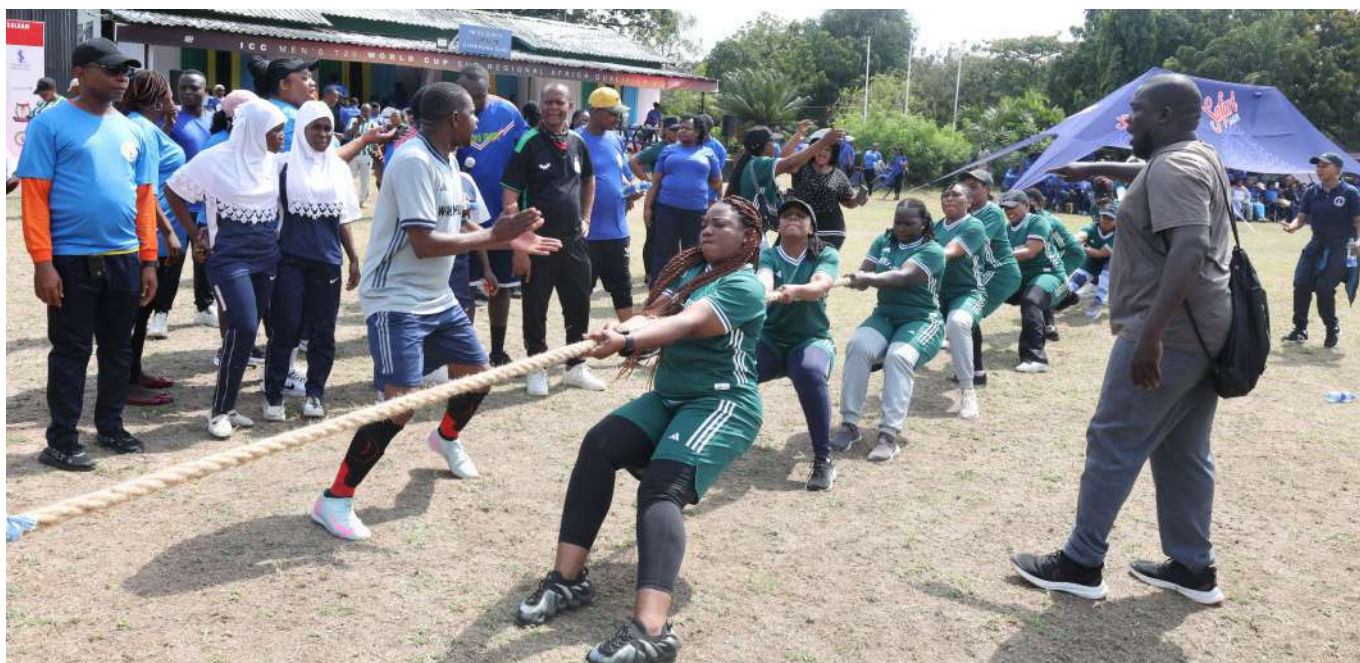
Wachezaji wa Timu ya Kamba ya Wanawake wa Ofisi ya Wakili Mkuu wa Serikali wakivuta kamba dhidi ya timu ya wanawake ya Wizara ya Viwanda na Biashara katika mchezo uliofanyika kwenye viwanja vya Furahisha jijini Mwanza.