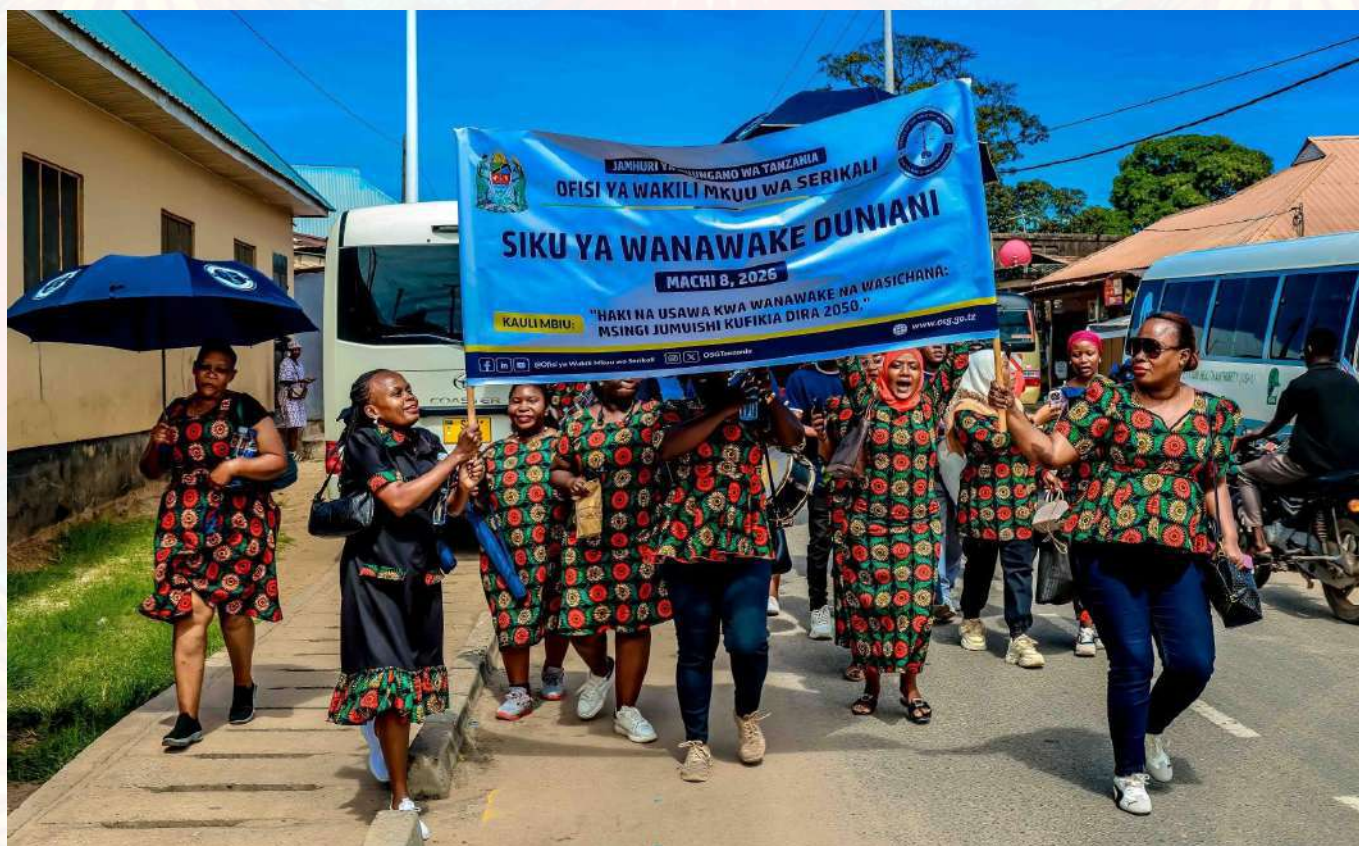
Baadhi ya wanawake wa Ofisi ya Wakili Mkuu wa Serikali wakielekea kushiriki Maadhimisho ya Siku ya Kimataifa ya Wanawake Duniani viwanja vya Barafu Mburahati Jijini Dar es Salaam .

Maadhimisho ya mwaka huu yaliongozwa na kauli mbiu isemayo, “Haki kwa wanawake na wasichana ni msingi wa maendeleo jumuishi kufikia Dira ya Taifa ya Maendeleo 2050.” Dhumuni la kauli mbiu hiyo ni kuhamasisha jamii kutambua umuhimu wa kuhakikisha wanawake na wasichana wanapata haki na fursa sawa katika elimu, uchumi na uongozi. Hatua hiyo itachangia kufanikisha maendeleo endelevu ya taifa.