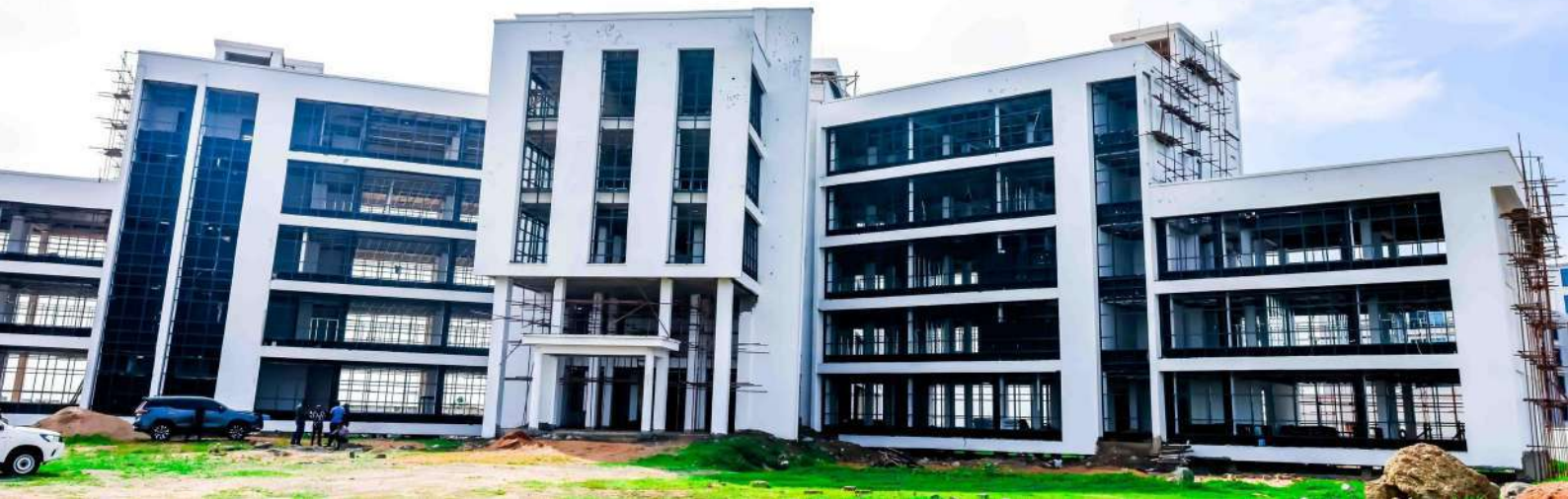
Muonekano wa jengo la Ofisi ya Wakili Mkuu wa Serikali linaloendelea kujengwa katika Mji wa Serikali, Mtumba - Dodoma.