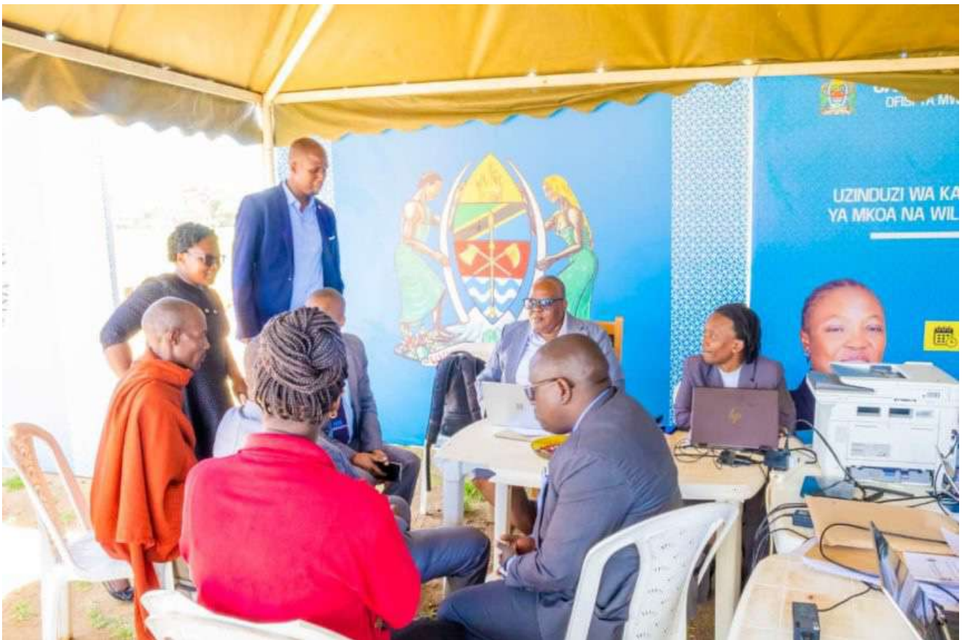
Baadhi ya Wananchi wa Mkoa wa Manyara wakipata msaada wa kisheria bila malipo wakati wa uzinduzi wa Kamati za Ushauri wa Kisheria ngazi ya Mkoa na Wilaya na Kliniki ya Sheria Bila Malipo.

Kliniki ya elimu na msaada wa kisheria bila Malipo iliratibiwa na kuendeshwa na Ofisi ya Mwanasheria Mkuu wa Serikali kuanzia tarehe 19 Januari, 2026 na kukamilika tarehe 25 Januari, 2026 mkoani Manyara wilaya ya Hanang’ katika viwanja vya Mount Hanang Katesh.